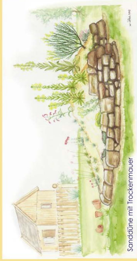
Sanddüne mit Trockenmauer